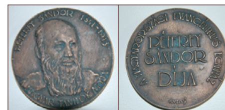
A Magyarországi Evangélikus Egyház Péterfy Sándor Díja