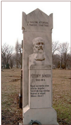
Péterfy Sándor díszsírhelye a Kerepesi úti temetőben

Idősebb korában fokozatosan kezdett visszavonulni a közéletből. Nyugdíjba vonulásakor (1896) királyi tanácsosi címet kapott.