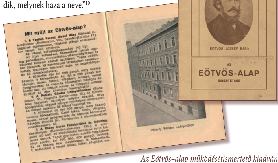
Az Eötvös-alap működésismertető kiadvány

„Egyszer, sőt mindösszesen szereztem én a tollammal annak előtte 200 forintot. A dolog meglepett, s akkor hirtelen eszembe jutottak a nyugdíjban nem részesülhető agg kortársaim, a tanítóözvegyek és árvák, és hirtelen elhatároztam magamban, hogy a nekem felajánlott 200 forinttal megvetem alapját a magyarországi tanítók Pestalozzi alapjának, az Eötvös-alapnak. Be akartam az ország és annak minden magára hivatott fia előtt bizonyítani, hogy azok, akik a nemzet zömét a népiskolában nevelik, amily szegény, éppen olyan életerős tagjai annak a munkásosztálynak, amely ama nagy alkotmány építése, védelmezése és szelvénye körül foglalatoskodik, melynek haza a neve.” 10