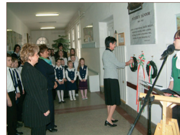
Koszorúzás az iskola folyosóján 2009-ben

Az év Érdeemes Diákja osztályával jutalomkirándulás keretében meglátogatja Péterfy Sándor szülőhelyét, Nemescsót. Találkoznak a helyi evangélikus gyülekezet lelkészével, vezetésével megtekintik a Péterfy Sándor születési adatait tartalmazó anyakönyvet és a templomot, majd felkeresik az emlékházat.