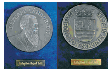
Győr-Moson-Sopron Megye Péterfy Sándor-díj

elméleti és gyakorlati munkájukkal kiemelkedően hozzájárulnak a korszerű, eredményes nevelés és oktatás megvalósításához.