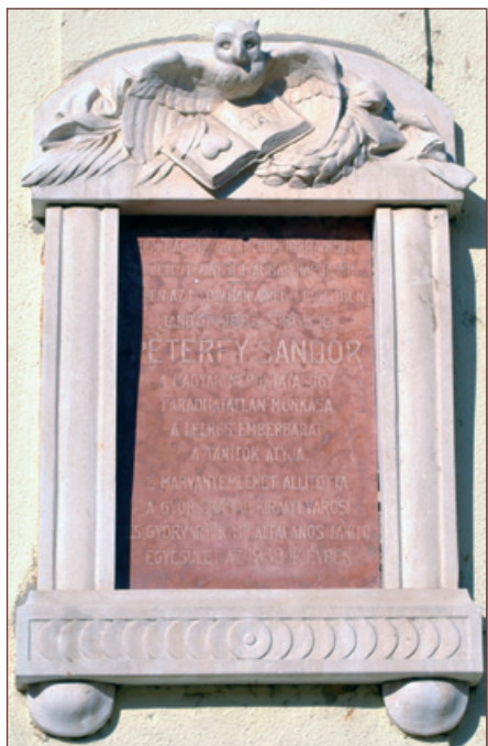
Vörös márványtábla a győri Péterfy Sándor Evangélikus Oktatási Központ külső falán

szem előtt tartva, a jövőbe tekintve munkálkodott egész életében. Mottója ma is megszívlelendő: Az iskolának a lelke a tanító. Az ő képzettségétől, buzgalmától függ minden. A jó tanító teszi a jó iskolát. 16