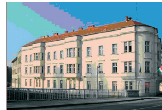
A győri Péterfy Sándor Evangélikus Oktatási Központ épülete (2012)

2002-ben a győri Péterfy Sándor Evangélikus Oktatási Központ a „Tanítók atyját” választotta névadójának.