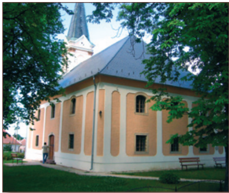
Nemescsón evangélikus temploma a XXI. században